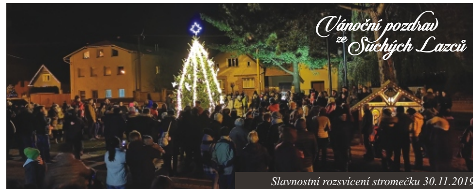
Slavnostní rozsvícení stromečku 30.11.2019