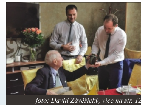
více na str. 12.