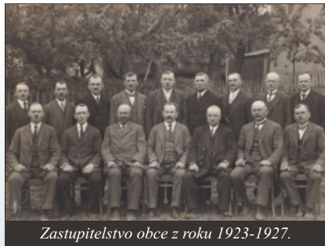
Zastupitelstvo obce z roku 1923-1927.