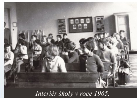
Interiér školy v roce 1965.