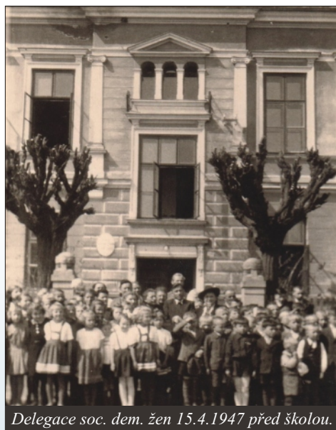
Delegace soc. dem. žen 15.4.1947 před školou.