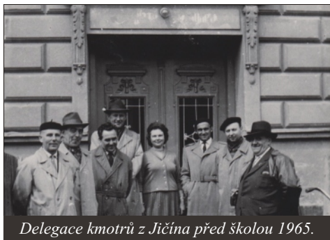
Delegace kmostrů z Jičina před školou 1965.

zřízen menší příčný kabinet. Ve třídě nad mateřskou školkou byla zjištěna závada v podlaze a hrozilo propadnutí stropu . Výuka byla převedena do tělocvičny do doby, než se našly finance na opravy. V roce 1969 žáci začali dostávat učebnice zdarma. Začalo se s opravou stropů , která skončila až 15. dubna 1970 , protože nebyl realizován projekt. To zastavilo také provoz jídelny, tekoucí vody a WC na delší dobu. Opravu realizoval Stavební podnik místního hospodářství v Kravařích. Došlo k výměně všech stropů, oken v přední části, opravě střechy, oplechování, WC, realizaci brizolitové fasády ( secesní fasáda byla nenávratně zničena ), vchodů, šaten, ústředního topení a elektroinstalace. Oprava si vyžádala 1.500.000,-Kč a trvala až do 6.9.1971 . Přichází nová ředitelka školy Vanda Kůrková a na škole je 70 žáků. První tři dny roku 1971 se vyučovalo v sále hostince RAJ . Ve škole bylo po slavnostním předání více místa, protože šatny byly již v suterénu . Na podlahách bylo linoleum a na WC splachovací záchody. V roce 1989 přichází " Sametová revoluce " a změna společnosti na demokratickou zemi. Vanda Kůrková působila jako ředitelka na škole až do roku 1995 . Následně ji vystřídala paní Alena Šmajstrlová . Od roku 2006 je ředitelkou školy Mgr. Martina Škrobánková . Během několika