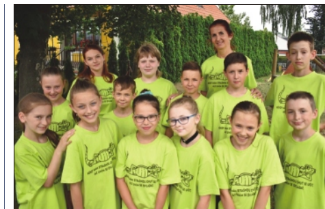
Základní škola Suché Lazce Pátáci 2013-2018