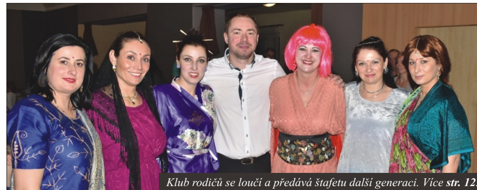
Klub rodičů se loučí a předává štafetu další generaci. Více str. 12.