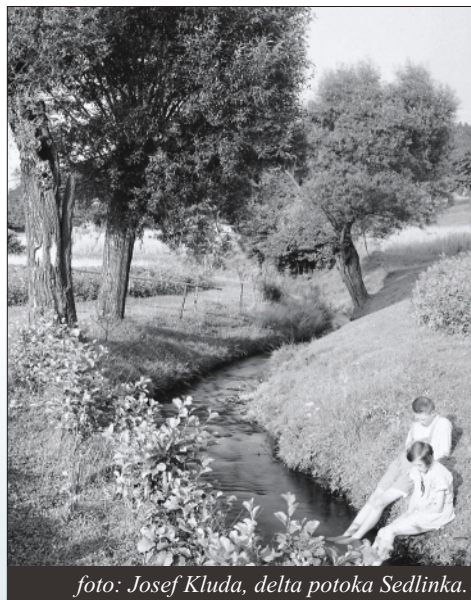
delta potoka Sedlinka.