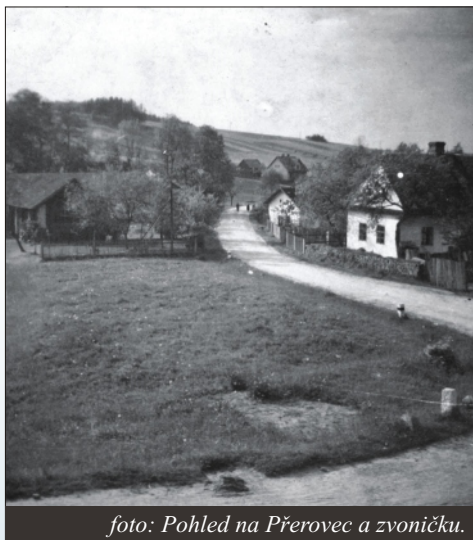
foto: Pohled na Přerovec a zvonicičku.