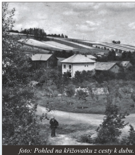
Pohled na křižovatku z cesty k dubu.