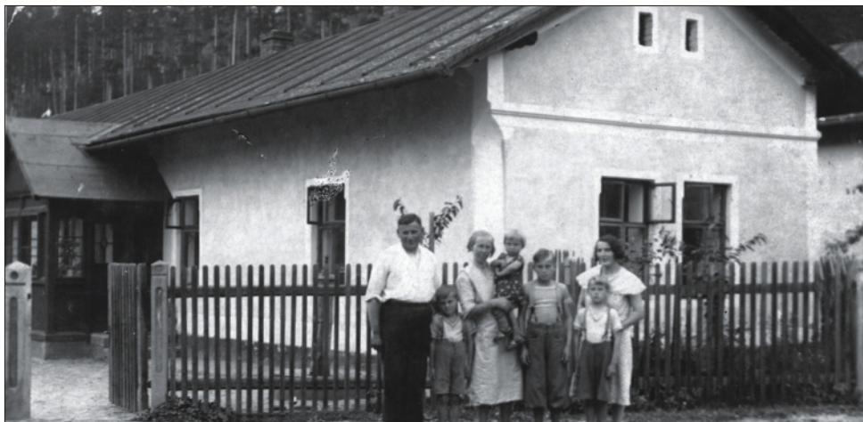
foto: dům č. 3 z roku přibližně 1930, zdroj: paní J. Němá a rodina Adamcová.

Kopie historických fotografií Přerovce, z archívu, od našich spoluobčanů.