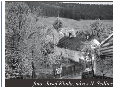
náves N. Sedlice.