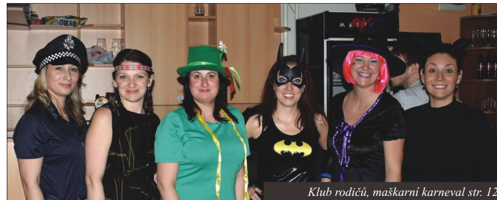
Klub rodičů, maškarní karneval str. 12.