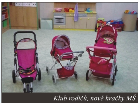
Klub rodičů, nové hračky MŠ.