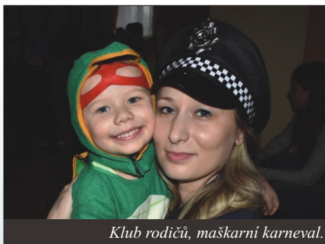
Klub rodičů, maškarní karneval.