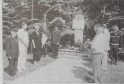
Kladení věnců u Pomníku padlých v Podvihově.