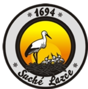
Volby 2014: Suché Lazce – Společně