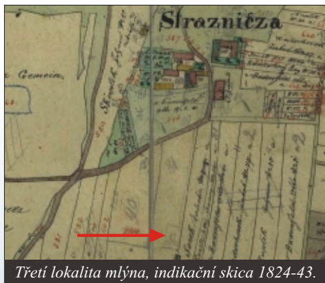
Třetí lokalita mlýna, indikační skica 1824-43.