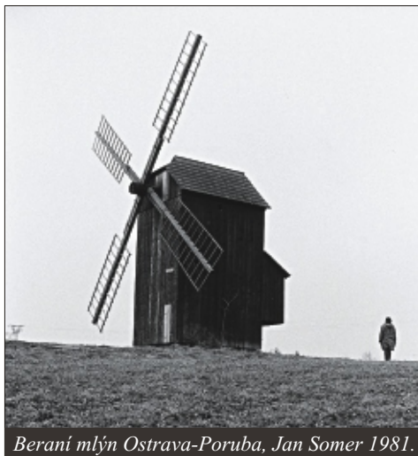
Beraní mlýn Ostrava-Poruba