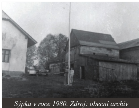
Sýpka v roce 1980.

Cepka (kdysi mlynáře Skuplíka) byla ještě v roce 1980 hospodářská budova s kamennými základy, která prvotně nejspíše sloužila jako sýpka . Odpovídá tomu celkový charakter stavby s malými okny určeným k ventilaci, obloukovým překladem u vchodu a dalšími typickými prvky. Viz fotografie.