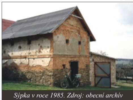
Sýpka v roce 1985.

Cepka (kdysi mlynáře Skuplíka) byla ještě v roce 1980 hospodářská budova s kamennými základy, která prvotně nejspíše sloužila jako sýpka . Odpovídá tomu celkový charakter stavby s malými okny určeným k ventilaci, obloukovým překladem u vchodu a dalšími typickými prvky. Viz fotografie.