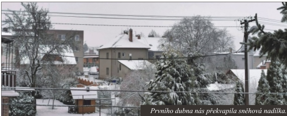
Prvního dubna nás překvapila sněhová nadílka.