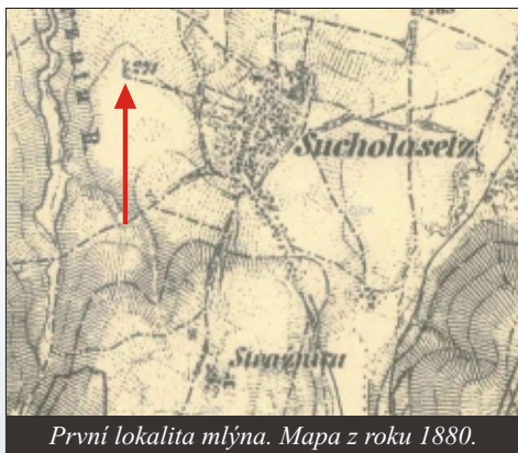
První lokalita mlýna. Mapa z roku 1880.

Druhý byl na mapě z 2. vojenského mapování z roku 1836 - 52. Byl umístěn na poli mezi