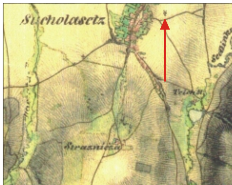
Druhá lokalita mlýna. II. vojenské mapování.