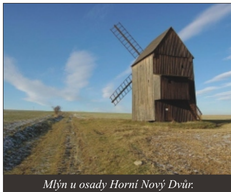
Mlýn u osady Horní Nový Dvůr.