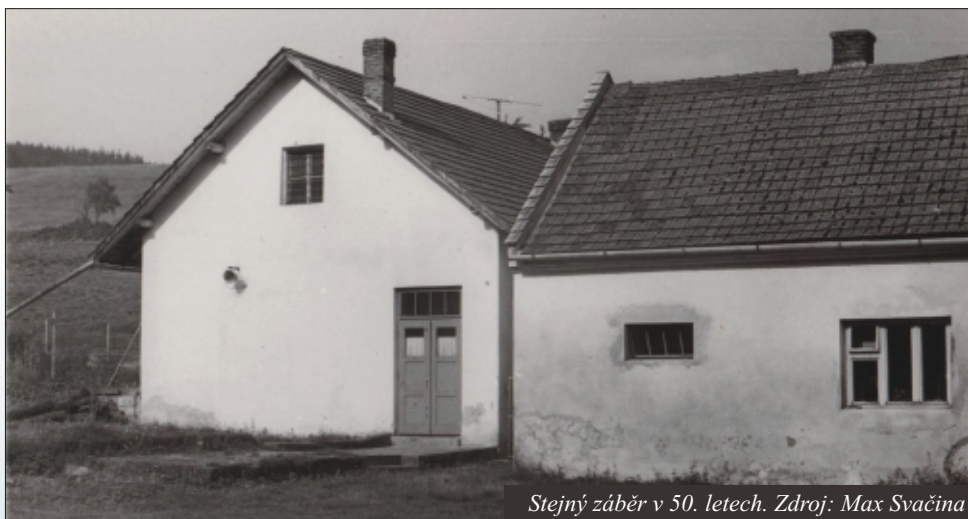
Stejný záběr v 50. letech.