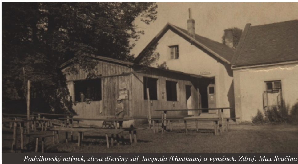
Podvihovský mlýnek, zleva dřevěný sál, hospoda (Gasthaus) a výměnek.