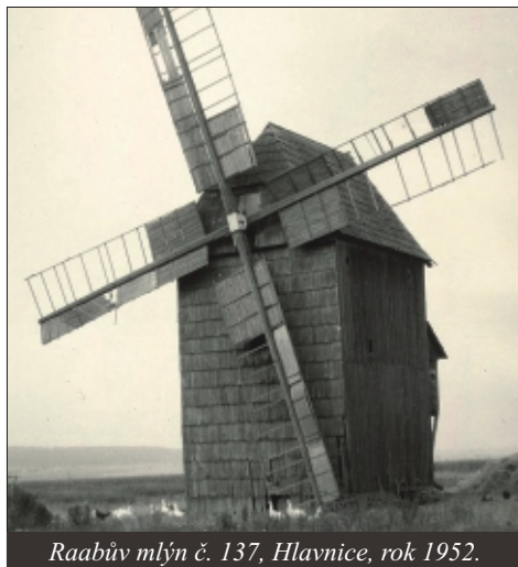
Raabův mlýn č. 137, Hlavnice, rok 1952.