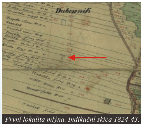
První lokalita mlýna. Indikační skica 1824-43.