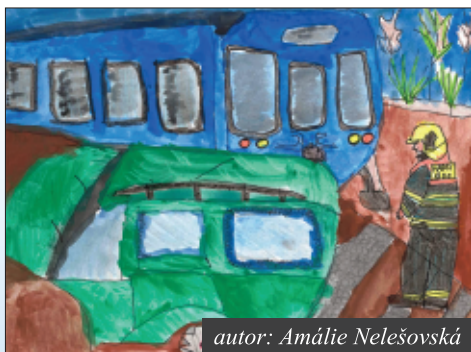
autor: Amálie Nelešovská

Přestože nás pandemie koronaviru dost omezila v naší činnosti, zvládli jsme se s dětmi i letos zúčastnit celorepublikové výtvarné a literární soutěže Požární ochrana očima dětí a mládeže ( POODM ), vyhlášené Sdružením hasičů Čech, Moravy a Slezska ( SH ČMS ). Letos bylo posláno celkem 9 obrázků do tří věkových kategorií. Obrovskou radost nám udělala