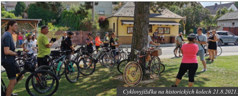
Cyklovýžďka na historických kolech 21.8.2021.