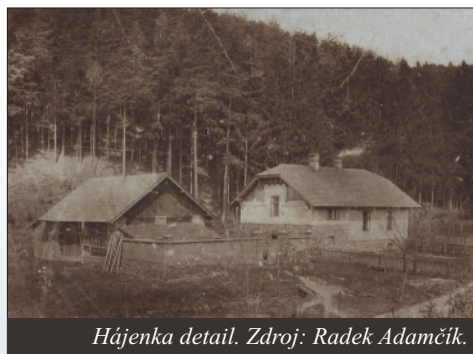
Hájenska detail.

Dvě třetiny hájenky zprava ( od cesty ) byly podsklepené a třetí levá část měla přízemní sklep, který sloužil jako chlév pro krávu . Uspořádání různých výšek stropů sklepů bylo