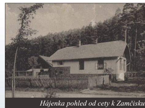
Hájenka pohled od cety k Zamčisku.

patrně i na vnější fasádě a dávalo tušit, že se jednalo o mezonetový dům. Sokl sklepa byl kamenný stylově ukončený cihlou. Základy stodoly a zděného plotu vybudovali také z kamene. Do budovy se vcházelo z druhé strany směrem od lesa. Střeška stodoly stejně tak jako hájenka byla pokrytá dřevěnými šindeli. Pod střeškou na půdě byl holubník. Průčelí domu směrem od stodoly mělo u přízemního sklepu ( chléva ) jednu dveře a vlevo od nich okno. V patře bylo pak velké kaslíkové okno a štít byl částečně obložen dřevem. Průčelí na druhé straně pak dominovala dvě velká okna v přízemí a dřevem obložený štít. Z uspořádání interiéru se dochovalo jen málo informací. V místnosti nad kravským chlévem byl pokoj, ve kterém žil spisovatel Antonín Ráb . Pravděpodobně v kuchyni stála velká modrofialová kachlová kamna. Kachle byly hladké bez vzoru a jejich zbytky se mi podařilo najít na zbořeníšti hájenky.