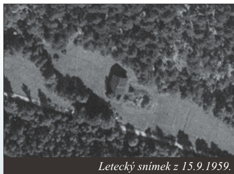
Letecký snímek z 15.9.1959.