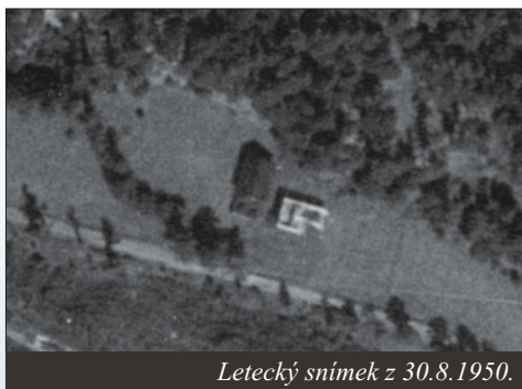
Letecký snímek z 30.8.1950.