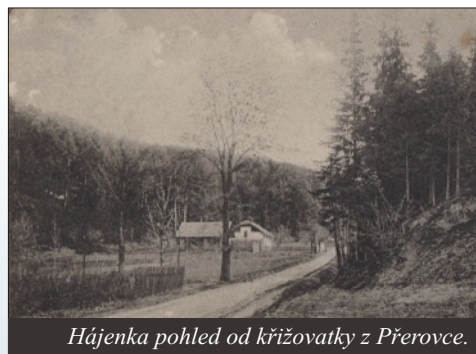
Hájenska pohled od křižovatky z Přerovce.

Hájenska se nacházela po levé straně na cestě od křižovatky ( N. Sedlice/S.Lazce/P. Polom )