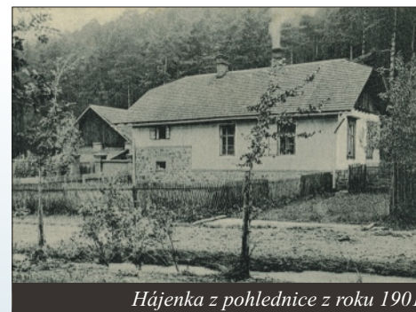
Hájenska z pohlednice z roku 1901