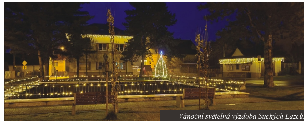
Vánoční světelná výzdoba Suchých Lazců.