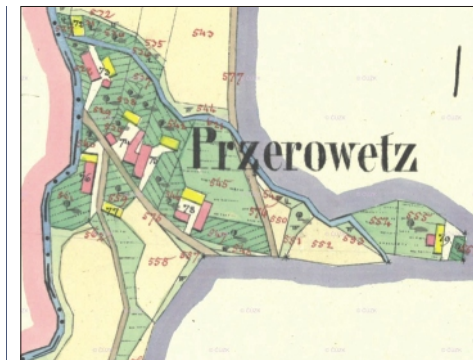
Mapa Přerovec stabilní katastr, hájenka č. 79.