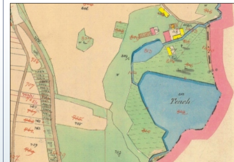
Indikační skica stabilního katastru, roku 1836.