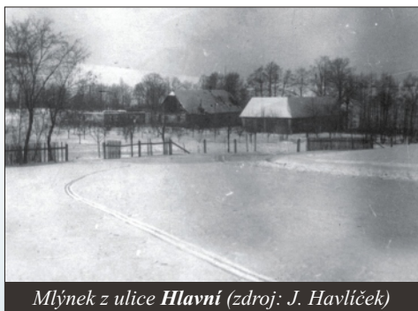
Mlýnek z ulice Hlavní