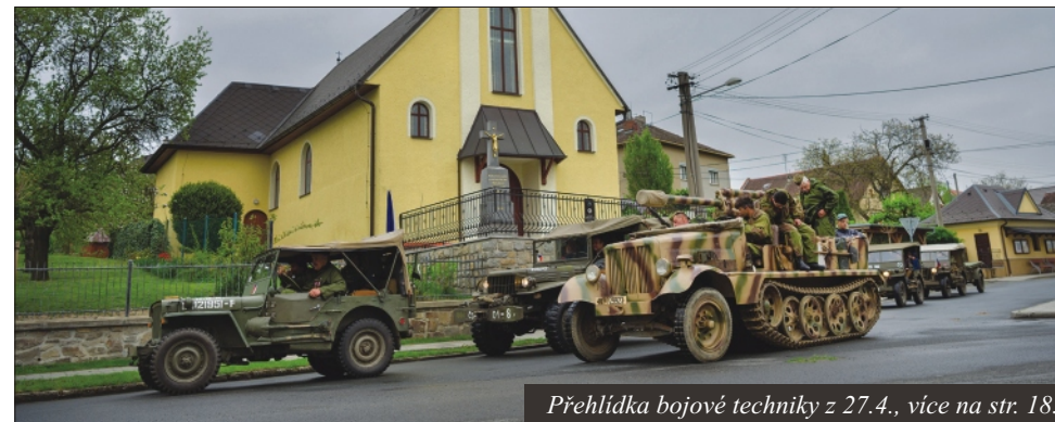
Přehlídka bojové techniky z 27.4., více na str. 18.