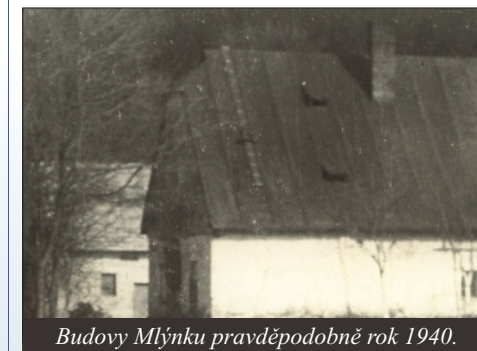
Budovy Mlýnku pravděpodobně rok 1940.