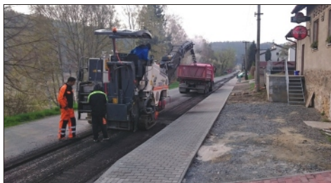
Celkem náklad 68.574 Kč 2018

Celkem náklad 92.055 Kč 2015 Celkem náklad 53.366 Kč 2016 Celkem náklad 43.120 Kč 2017