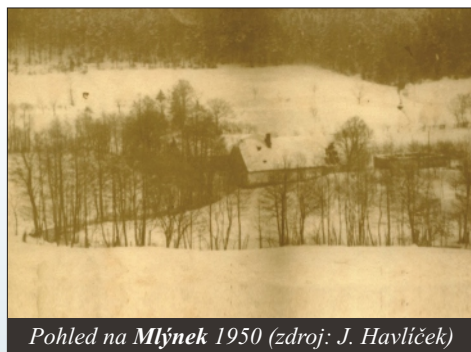
Pohled na Mlýnek 1950