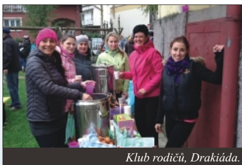
Klub rodičů, Drakiáda.

Podzimní Taškařice III - začala 4.11. v pátek v 18 h. u ZŠ. Děti postupně přicházely ve strašidelných maskách a potěšili nás i rodiče v kostýmech. První úkol byl nakreslit před školu na cestu křídou strašidlo. Za odměnu dostaly bonbón a dřevěného ježečka, aby se na stezce odvahy nebály. Následovala trasa plná úkolů kolem hřbitova, směr Strážnice, přes černý les a větrnou louku až k restauraci Heja. Na této cestě děti potkaly čarodějnice, duchy, čerty, hejkala, ohnící a jiná lesní strašidla. V cílové stanici dostaly všechny odvážné děti teplý čaj, hranolky a medailky za odvalu. Tímto děkujeme restauraci Heja. Klub rodičů dále děkuje všem rodičům a dětem, kteří se akce zúčastnili. Velký dík patří i rodičům a dobrovolníkům, kteří připravili pro děti i rodiče nezapomenutelné okamžiky. Bez Vás by to nešlo, díky!