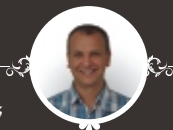
redakce David Závěšický

Další Sucholazecký zpravodaj vyjde v březnu 2017, posílejte náměty, podklady