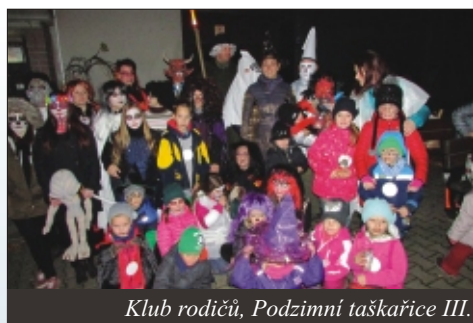
Klub rodičů, Podzimní taškařice III.