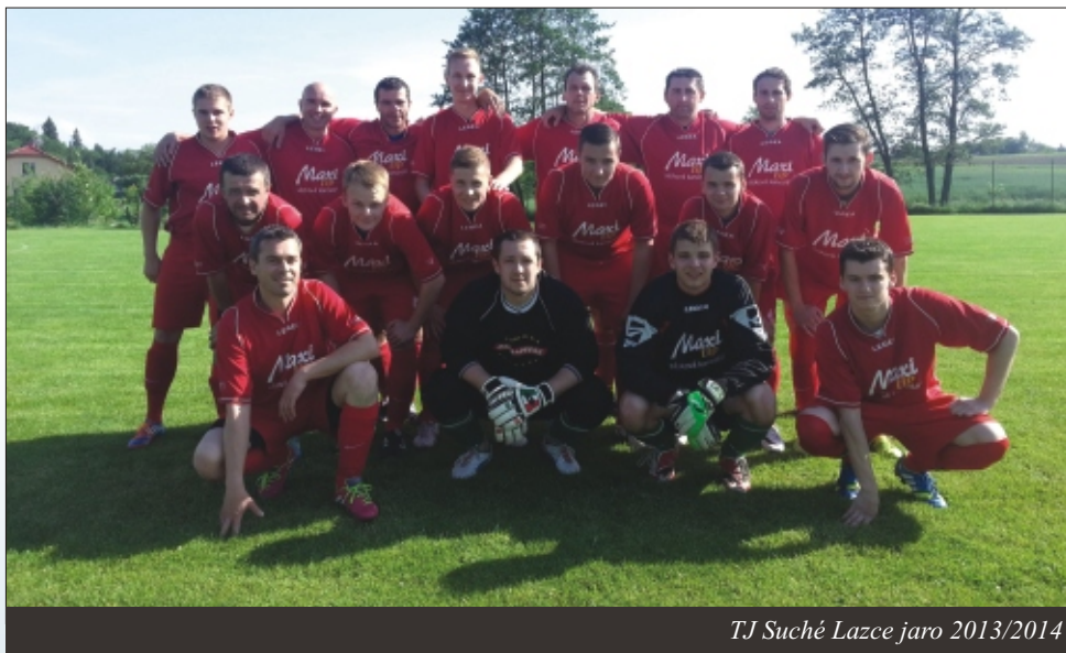
TJ Suché Lazce jaro 2013/2014