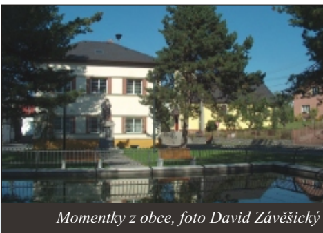
Momentky z obce

Chtěli bychom jim touto cestou poblahopřát. Letos se dožije 80 let sedm občanů, 81 let - 5, 82 let - 4, 83 let - 3, 84 let - 2, 85 let - 4, 86 let - 4, 87 let - 3, 89 let - 1, 90 let - 1, 91 let - 1, 92 let 1 a náš nejstarší občan se dožije 94 let.